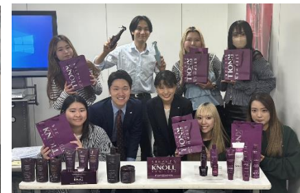
社会人基礎/接客基礎